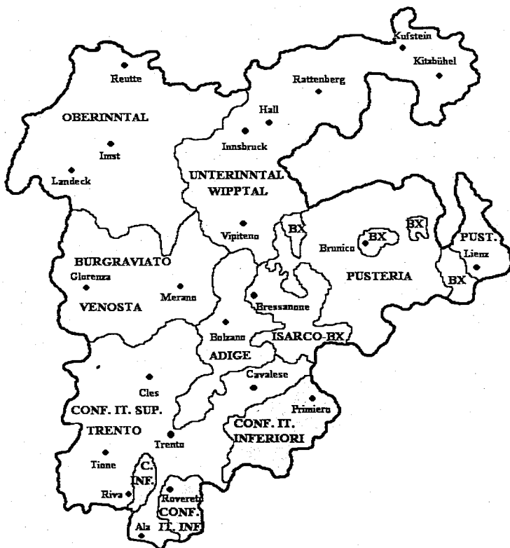
Fig. 1. La ripartizione del territorio trentino-tirolese in quartieri fiscali («Viertel»), 1542-1609

1542-1554: tre quartieri : 1. Inn - 2. Pusteria - 3. Adige.