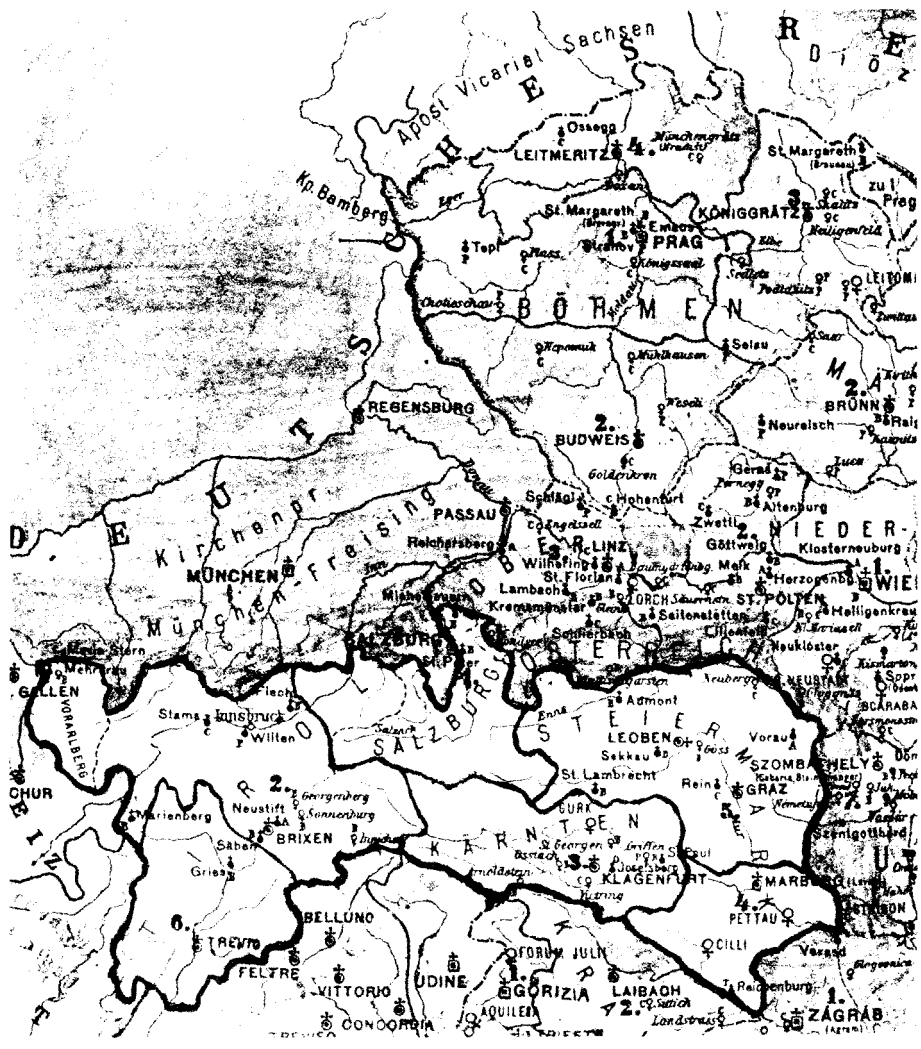
Fig. 1. La provincia ecclesiastica di Salisburgo (1848-1918)