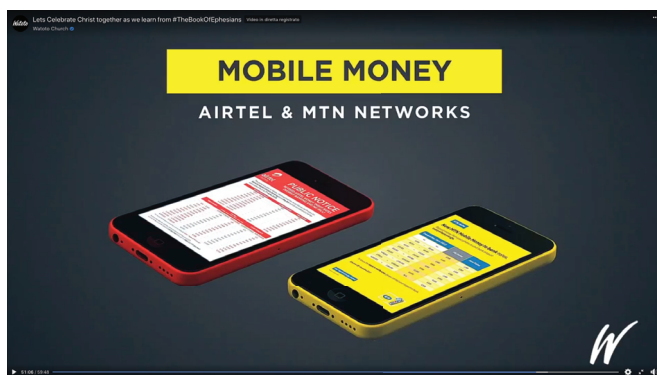
Fig. 3. Watoto, «You can give using mobile money» https://www.facebook.com/watch/live/?v=375625033833751&ref=notif&notif_id=160058522254117&notif_t=live_video .

Un altro aspetto della strategia digitale della Chiesa riguarda l'autofinanziamento che avviene attraverso donazioni realizzate nella forma del mobile money , un sistema di circolazione di denaro digitale che si è diffuso in Africa orientale a partire dal 2007. Qui le principali compagnie telefoniche offrono la possibilità di trasferire denaro sul numero telefonico di un cliente, che poi potrà convertire questa somma in contanti presso una delle numerosissime piccole agenzie diffuse sul territorio. In questo modo è possibile far circolare dei fondi senza ricorrere all'intermediazione bancaria, che per i più risulta troppo costosa. Le Chiese pentecostali ugandesi hanno prontamente adottato questa efficiente modalità di transazione nei processi di autofinanziamento.