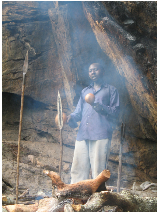
Fig. 1. Un medium in trance nel luogo sacro di Mubende.

La religione precoloniale praticata in tutta la regione dei Grandi laghi è un culto di possessione chiamato Kubandwa, fondato su un pantheon di figure spirituali che comprende spiriti di antenati familiari, sovrani e capi defunti, divinità, eroi nazionali e altre entità mistiche contenuti in luoghi naturali o in oggetti sacri. La comunicazione tra questo complesso pantheon spirituale e i viventi avviene attraverso medium iniziati posseduti dagli spiriti, che parlano in loro vece in diverse occasioni rituali. I riti si basano su complessi sistemi di rappresentazione pluricodice non privi di un'importante dimensione spettacolare, che emerge in tutte le varianti locali del culto. Le parole pronunciate e reiterate dai medium in trance , le musiche, le danze, la gestualità, i costumi, gli oggetti sacri, i profumi, i sapori e la liturgia nel suo insieme veicolano nel tempo e nello spazio i simboli e i significati del discorso religioso.