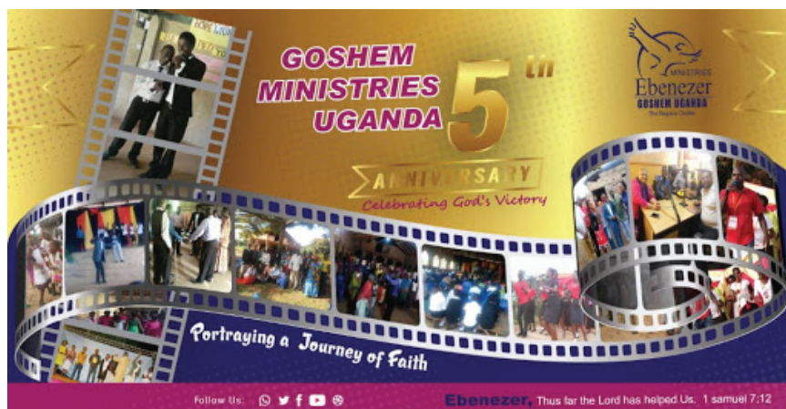
Fig. 4: Manifesto pubblicitario di una chiesa pentecostale ( https://www.facebook.com/GoshemUg/ ).

gia la dimensione estetica, corporea ed emozionale. L'ingresso sulla scena religiosa dei media elettronici ha offerto la possibilità di ricreare con le immagini e i suoni l'esperienza fisica della devozione in forme spettacolari ancora più efficaci. Se i media hanno sempre costituito il veicolo di trasmissione di simboli e significati, i media digitali offrono oggi la possibilità di creare nuovi universi cosmologici, utilizzando forme espressive estremamente realistiche e richiamando allo stesso tempo l'antica esperienza della possessione spiritica.